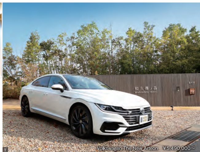
Volkswagen The New Arteon ¥5,490,000~