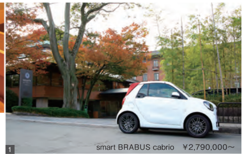
smart BRABUS cabrio ¥2,790,000~