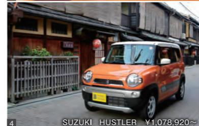
SUZUKI HUSTLER ¥1,078,920~

東山宮川町の「路地中ノ」。ホテルの割烹で修行を積んだ店主が選び抜いた新鮮なネタのお寿司はもちろん、せものではなく銅器を使った銅瓶蒸しなど、ユニークな発想の京料理が味わえます。