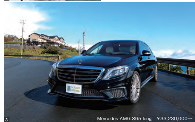
Mercedes-AMG S65 long ¥33,230,000~