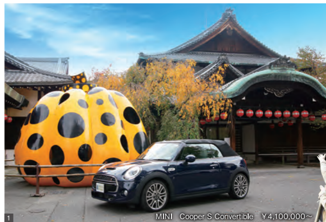
MINI Cooper S Convertible ¥4,100,000~