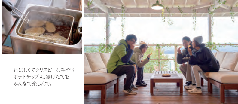
香ばしくてクリスピーな手作りポテトチップス。揚げたてをみんなで楽しんで。